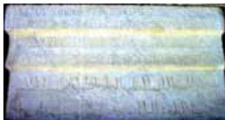
Foto 5. Questa iscrizione, incisa su una lastra di marmo da 77,4 x 51,6 cm, è in tre lingue: latino, greco e arabo.

edificato da re Ruggero II di Sicilia (1093-1154), re nel 1131. Secondo i documenti dell'epoca, esso sarebbe stato costruito seguendo la tradizione degli orologi ad acqua arabi. Foto 5.