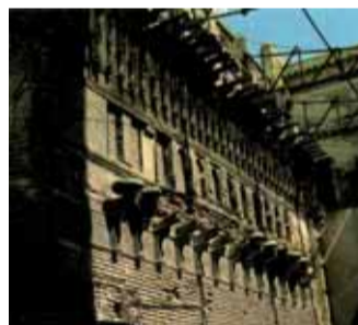
Foto 4. Resti dell'orologio monumentale chiamato Bou-Anania, presso il quartiere alto della Medina di Fez in Marocco, costruito dall'emiro Abou Inane, da cui prende il nome. Sono ancora visibili dodici finestre da cui cadevano delle biglie per far risuonare le sottostanti 13 grandi campane sostenute da mensole di legno di cedro scolpite.

Contemporaneo fu quello realizzato a Malta, in cui una figura di ragazza lasciava cadere in una campana di rame, da dodici diverse finestre, un numero di biglie pari all'ora corrispondente. Anche in Oriente l'orologeria diede origine a straordinarie macchine provviste da automi. La Cina fu la prima a creare fin dal VII secolo un orologio idraulico mosso da una ruota, ma aveva il difetto di fermarsi quando l'acqua gelava. La più grande e più strabiliante invenzione avvenuta durante la dinastia Song, fu l'orologio astronomico di Su Song (1020-1101). Il suo meccanismo era talmente complesso che solo recentemente si sia riuscito a riprodur-