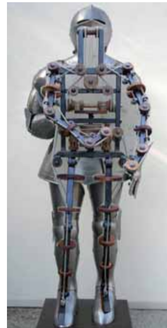
Foto 8. Una delle ricostruzioni dell'automata ideato da Leonardo. Corde al posto di nervi e muscoli; carrucole alle articolazioni. La trazione e l'allentamento rendono possibile il piegamento e la distensione delle membra. Oltre ad essere impiegato per uso teatrale, fu adattato per un ricevimento reale, dove diversi automi, allineati in formazione, con un particolare comando alzavano le braccia per il saluto al sovrano.

le fu applicata alle serrature e agli orologi, studiata anche da Leonardo nel "Codice di Madrid", permise di affrancare, dal XVI secolo, gli automi da una forza esterna e fornire l'energia interna al meccanismo necessaria al movimento.