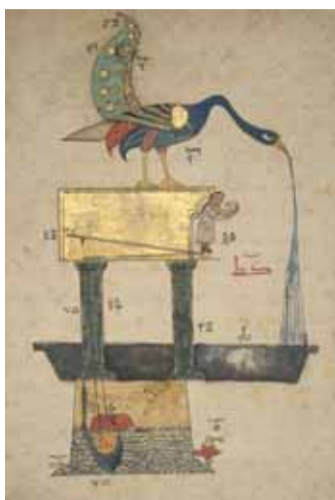
Foto 3. Illustrazione autografa della fontana del pavone di Al-Jazari. Azionando come leva la coda del pavone fuoriesce del becco l'acqua, e come la vasca sottostante si riempie un galleggiante aziona una fune, che fa apparire, da dietro una porta sotto il pavone, la figura di un servo, che offre il sapone. Quando si utilizza più acqua per risciacquarsi, un secondo galleggiante posto a un livello superiore provoca la comparsa di un secondo servo, questa volta con un asciugamano!

L'orologio ad acqua era utilizzato in passato dai musulmani in alcune città del Marocco, prima della scoperta del moderno oro-