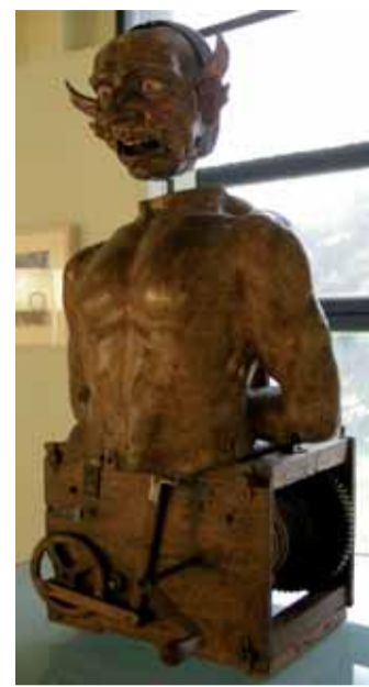
Foto 7. Automa, del XV-XVI secolo, raffigura un demone di legno intagliato. Girando la manovella, la faccia muoveva occhi e lingua, ed emetteva sia un suono, sia fumo dalla bocca. Proviene dalla Wunderkammer già di Ludovico Settala. Oggi si trova nelle Raccolte d'arte applicata del Castello Sforzesco di Milano.

Foto 6. Ricostruzione dell'orologio di Su Song, presente al British Museum. Fu costruito nel 1094 dall'astronomo Su Song, che lo chiamò "Le note del ruscello dei sogni". Impiegò più di dieci anni per progettare e costruirlo. Esso era collocato nei piani superiori del palazzo dell'imperatore Khaifeng (1092-1126). Era una costruzione di tre piani alta 10 metri, che utilizzava l'acqua per muovere in modo preciso e costante una ruota gigante, alla quale erano collegate decine di ruote, alberi e leve. Sulla piattaforma alla sommità, era collocata un'enorme sfera armillare in bronzo, all'interno della quale ruotava automaticamente un globo celeste. Segnalava anche, con l'ausilio di automi, campane, tamburi, gong, e fischi, le ore e i quarti. Un'altra riproduzione è esposta al Museo della Scienza di Pechino.