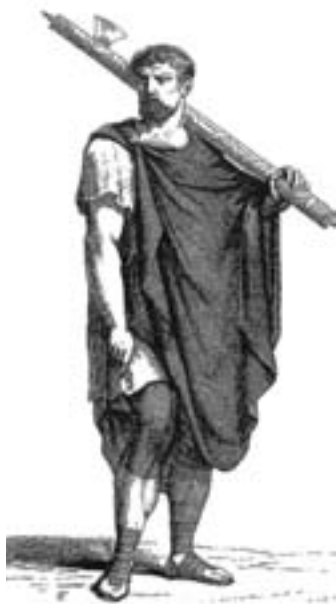
Foto 3. Littore, in latino lictor , deriva dal verbo ligo = io lego (da cui ligator , lictor , lictor ) perché era colui che recava i fasci di verghe legate insieme. I littori erano membri di una speciale classe di servitori civili dell'antica Roma che, sia in Età Repubblicana sia in quella Imperiale avevano il compito di proteggere i magistrati dotati d' imperium , cioè di potere e comando. L'origine dei littori risale all'Età regia e derivava forse dagli Etruschi. Il nome fascies , il cui significato originale etimologico appare ancora nell'italiano fascio e fascina, sta a indicare il carattere fondamentale di questo simbolo, ossia il legame e l'unione delle varie verghe del fascio in un'unità cui compete l'imperio della giustizia rappresentato dalle verghe.

Tutti conosciamo il racconto biblico, dove Mosè e i sacerdoti del faraone si affrontano trasformando in serpenti i propri bastoni, che ci conferma il loro uso anche a corte. È in Oriente in area assiro-babilonese che il bastone assurse al rango di oggetto di lusso, non solo rituale o pratico. In linea di massima il bastone lungo era attribuito regale o divino, mentre quello corto era riservato ai dignitari. Il pedum era il classico bastone romano, oggetto d'uso, usato dai pastori per tenere a bada il gregge, per difesa, per cacciare, per raccogliere la frutta meno accessibile. Ad un gancio in cima al bastone si poteva appendere una fiasca, una zucca per l'acqua o un fagotto col cibo, per agevolare il trasporto a spalla o, una volta piantato a terra, per proteggerli dalla polvere e dagli insetti. Esso era anche simbolo di comando, dai fasci di verghe, che accompagnavano i consoli, alla canna messa in mano al Cristo per dileggiarne la regalità. (Foto 3)