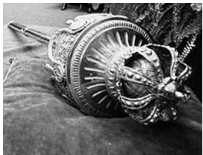
Foto 8. Mazza cerimoniale, inaugurazione dell'anno giudiziario a Torino.

Per quesiti, informazioni, perizie, vendite e acquisti prendere contatto con l'autore alla casella di posta elettronica: info@antichitasantoro.com e visitare il sito www.antichitasantoro.com .