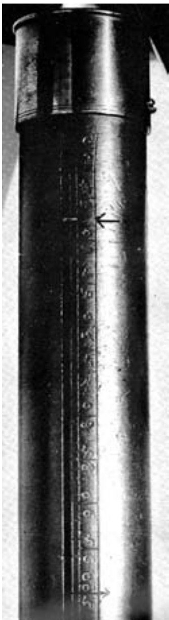
Foto 7. Bastone provvisto di pedometro. Germania 1570 circa. Un cursore indicato dalla freccia scende a ogni appoggio, indicando il numero di passi percorsi.

Durante le Crociate e fino al Cinquecento il bordone o baculo fu segno distintivo del pellegrino, che si recava in Terra Santa. Durante il medioevo il bastone tornò a essere simbolo di una carica; tipici quelli corti degli araldi; anche le donne ne adottarono di lunghi, spesso di canna, perché più leggeri, e ornati di nastri. Il bastone evidentemente è anche un simbolo fallico, soprattutto quando dritto termina con un pomolo; ecco perché probabilmente i nastri, oltre a soddisfare desideri di decorazione delle dame, li differenziavano da tale similitudine. Nel Rinascimento per le dame comparvero anche corti bastoni d'avorio, omaggio spesso regale e segno di particolare distinzione a corte. I Monarchi sfoggiavano bastoni lunghi dalla ric-