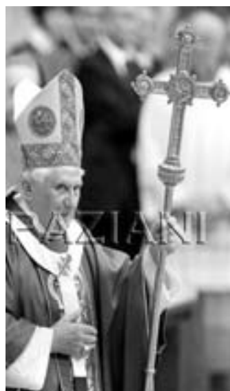
Foto 5. Benedetto XVI con il pastorale proprio del Papa, Vescovo di Roma.

Durante le Crociate e fino al Cinquecento il bordone o baculo fu segno distintivo del pellegrino, che si recava in Terra Santa. Durante il medioevo il bastone tornò a essere simbolo di una carica; tipici quelli corti degli araldi; anche le donne ne adottarono di lunghi, spesso di canna, perché più leggeri, e ornati di nastri. Il bastone evidentemente è anche un simbolo fallico, soprattutto quando dritto termina con un pomolo; ecco perché probabilmente i nastri, oltre a soddisfare desideri di decorazione delle dame, li differenziavano da tale similitudine. Nel Rinascimento per le dame comparvero anche corti bastoni d'avorio, omaggio spesso regale e segno di particolare distinzione a corte. I Monarchi sfoggiavano bastoni lunghi dalla ric-