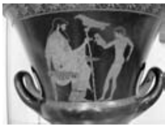
Foto 1. Ganimede versa una libagione a Zeus. Cratere attico a figure rosse del pittore di Eucharidès 490-480 a.C. Metropolitan Museum of Art (New York). Notiamo il nodoso bastone del re dell'Olimpo.

Per bastoni s'intendono diverse tipologie di oggetti aventi in comune la caratteristica di estendersi in lunghezza più che in larghezza e di essere stati sempre e in ogni luogo presenti con tre funzioni fondamentali: appoggio, difesa, apparato. Questa descrizione molto generica fa comprendere immediatamente quanto sia vasta la tipologia dei bastoni. (Foto 1)