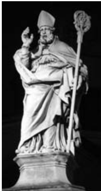
Foto 6. La statua di San Petronio, patrono Bologna, collocata davanti alle due torri, completa di pastorale vescovile.

La liturgia cristiana colloca il bastone in una posizione preminente, assumendolo a simbolo del Buon Pastore, com'era spesso chiamato il Cristo, pastore di anime, soprattutto nelle prime comunità cristiane. Il pedo è l'attributo delle alte gerarchie cattoliche episcopali, un pastorale alto e dritto sormontato da un crocefisso per il Papa, quale vescovo di Roma, con terminale a riccio per gli altri Vescovi. (Foto 5)