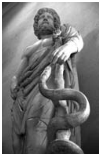
Foto 4. Statua di Esculapio. Museo di Epidauro, teatro. Il padre della medicina con la verga cui si arrotola un serpente. Oggi si ritiene che tale verga abbia origine dalla vicenda della prigionia degli ebrei. Le popolazioni che vivevano colà soffrivano di un parassita noto come Dracunculus medinensis . Erano vermi che si sviluppavano al di sotto della cute e che potevano arrivare sino a mezzo metro di lunghezza. Il sistema per liberarsene consisteva nel farli arrotolare lungo un bastoncino.

I Vescovi greco-ortodossi lo portano con un'asticella terminale variamente decorata. Il 4 ottobre 2001 la statua di San Petronio, realizzata dallo scultore Gabriele Brunelli per l'Arte dei Drappieri nel 1683, è stata ricollocata in piazza di Porta Ravennana, davanti alle due torri, da dove era stata rimossa alla fine dell'Ottocento per motivi di traffico. In un primo momento la statua era priva del pastorale, poi, in seguito a numerose segnalazioni, una copia in resina di quello originale, molto pesante e che già era rovinato pericolosamente a terra in passato, è stata collocata quale necessario simbolo del Vescovo patrono della città. (Foto 6)