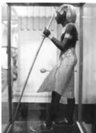
Foto 2. Statua di Tutankhamon di legno, museo del Cairo. Una delle sculture in cui il faraone è mostrato con un lungo bastone.

La civiltà egizia fu ricca di bastoni sia corti sia lunghi, documentati in disegni e incisioni; uno degli esempi più noti è quello della tomba di Tutankhamon, dove sono stati ritrovati diversi bastoni; molti dei quali erano appartenuti ai vari dignitari quale segno del loro ufficio, ed erano stati li depositati in segno di omaggio. (Foto 2)