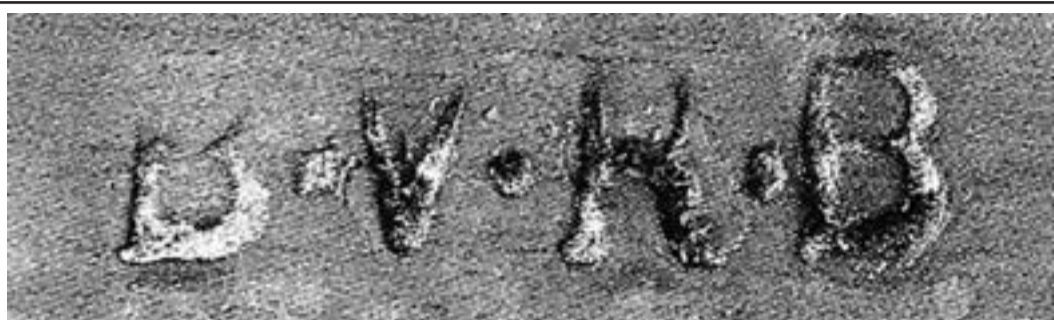
Foto 4. Estampille, su legno di rovere, di Bernard II Van Riesen Burgh, maître intorno al 1730, nato dopo il 1696 circa nel 1766. Forse il più grande ebanista del suo tempo, che lavorò soprattutto per marchands-merciers come Hébert, Lazare Devaux e Simon Poirier. Il suo marchio porta solo le iniziali a causa dell'origine olandese o più probabilmente per celare la propria identità, come richiesto dai marchands per cui lavorava, che pretendevano l'anonimato dai loro fornitori per non farli conoscere ai propri clienti.

Gobelins, al Louvre o all'Arsenale, i quattro ebanisti privilegiati del Re, ecc. I marchands-merciers (mercanti-mercieri) non erano soggetti ad alcun obbligo e potevano anche acquistare gli arredi direttamente dagli operai liberi; a volte falsificavano le estampilles per dare maggior credito alla loro merce. (Foto 4)