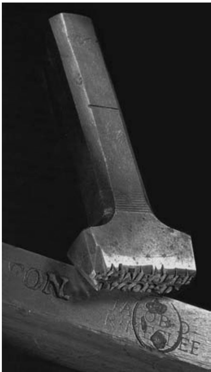
Foto 1. Punzone originale di François-Honoré-Georges Jacob, che continuò l'opera del grande padre. Marchio adottato dal 1803 al 1813, il più rappresentativo degli ebanisti dell'Impero. Foto d'archivio.

La traduzione più vicina a estampille è marchio, sia nel senso attuale di nome identificativo della ditta che lo utilizza, sia in quello tecnico di marchiato, impresso. (Foto 1)