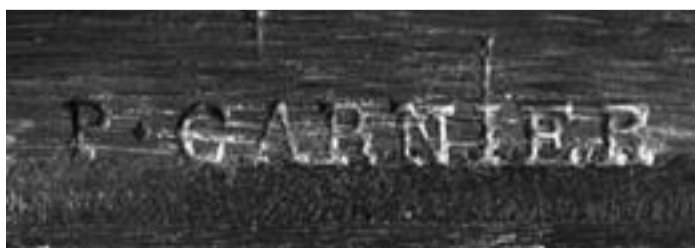
Foto 2. Estampille, su legno di rovere, evidenziata con un po' di gesso. Pierre Garnier, nato circa 1720 morto 1800, maître il 31 dicembre 1742. Uno dei grandi maestri che accompagnò l'evoluzione del mobile dal Rococò al Neoclassico.

Non erano soggetti all'obbligo di marchiatura gli artigiani non parigini, salvo statuti locali come quelli vigenti in altre grandi città, come Bordeaux, Lione, ecc., i lavoratori liberi e gli ebanisti residenti nei luoghi privilegiati (con statuti risalenti al medioevo), come gli enclos: de Saint-Jean-de-Latran, du Temple, de Saint-Denis-de-la-Chartre e, soprattutto, dell'abazia di Saint-Antoine des-Champs che controllava il faubourg Saint-Antoine, quartiere degli ébénistes . Vi erano poi anche gli ebanisti dispensati per privilegio reale, installati a