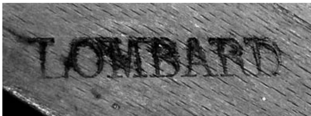
Foto 6. Estampille, a fuoco su legno di rovere, di Lombard, fabbricante di sedili via Saint-Louis-au-Marais n° 20, dal 1835 al 1848. Questo marchio dimostra il perdurare delle estampilles nell'Ottocento. Foto d'archivio.

Per quesiti, informazioni, perizie, vendite e acquisti prendere contatto con l'autore alla casella di posta elettronica: info@antichitasantoro.com e visitare il sito www.antichitasantoro.com .