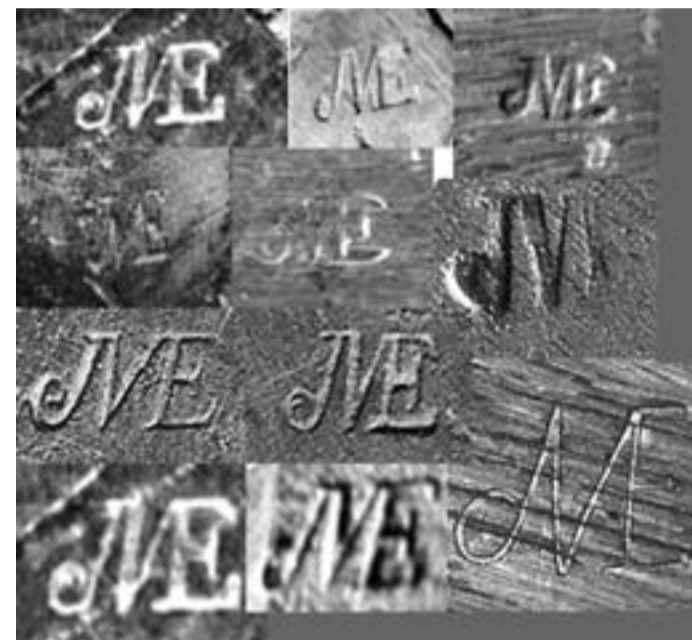
Foto 5. Diverse estampilles della jurande, che mostrano la notevole varietà dei punzoni. Foto d'archivio.

In fine i privati potevano comprare direttamente dagli artigiani arredi non stampigliati, con il solo obbligo di ritirarli personalmente presso l'atelier. I giurati della corporazione risiedevano presso la comunità dei menuisiers-ébénistes in via della Mortellerie e avevano l'obbligo di visitare i laboratori quattro volte l'anno, confiscando gli arredi privi di marchio dell'ebanista o difettosi e apponendo il loro: JME (JME, sta per Jurande des Menuisiers Ebénistes , corpo degli ufficiali giurati dei falegnami-ebanisti). (Foto 5)