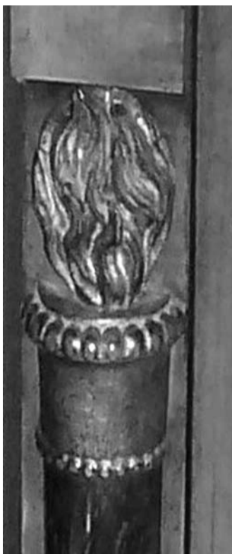
Fiamma della fiaccola intagliata e dorata a foglia.

L'eccezionale stato di conservazione di quest'arredo ha permesso di mantenerlo originale, dal momento che, nel corso dell'Ottocento, esso è stato quasi sempre sostituito da fregi d'ottone dorati galvanicamente, divenuti ormai economici. La cornice sotto il timpano è di legno ebanizzato. L'ebanizzazione di parti degli arredi è un'altra peculiarità del biedermeier. In questo modo si realizzavano contrasti cromatici, che permettevano a basso costo di evidenziare particolari. Per l'ebanizzazione si usava principalmente il legno di pero od in alternativa anche il noce, tinti con vernici a base di nero fumo e gommalacca. La presenza d'ebanizzazioni sui mobili neoclassici è un buon elemento di datazione, perché è avvenuta principalmente per influenza del biedermeier. Ad esempio i comuni cassettoni di noce con colonne o lesene ebanizzate sono eseguiti dopo il periodo impero e sarebbe più corretto definirli appunto biedermeier. I particolari di legno scolpito e dorato sono ben eseguiti, ma non raggiungono mai la qualità di quelli realizzati in Italia, che in questo campo resta maestra indiscussa. Anche in questo caso essi sostituiscono in maniera più economica l'ornamentazione di ottone dorato a fiamma, tipica dei più raffinati arredi francesi.