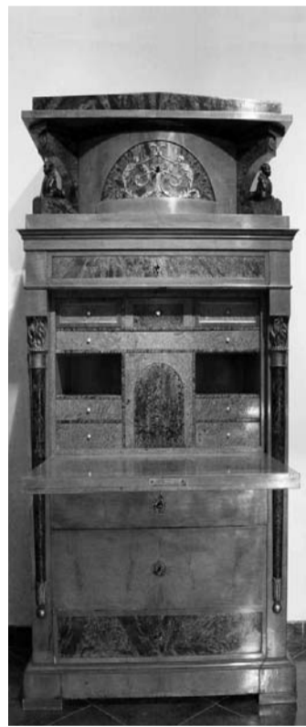
Secrétaire tedesco aperto. Misure cm: h. 189x56x103. Epoca e stile: Biedermeier (1815-48). Le parti macchiettate, come il fondo della lunetta dietro il fregio, sono di betulla fiorita.

Questo comportò l'utilizzo forzato d'essenze esotiche per lo più chiare (tuya, limone, ecc.), modificando addirittura il gusto in favore di esse. Nonostante la predilezione per essenze chiare, tuttavia arredi biedermeier sono stati fabbricati anche di mogano essenzialmente per due motivi: in primo luogo perché il mogano restò fino alla metà dell'Ottocento l'essenza più utilizzata per i mobili di pregio, in secondo luogo perché prodotti dopo il 1830, quando con il battello a vapore esso divenne decisamente più economico, grazie ai minori costi di trasporto ed alla generale adozione di mezzi di tranciatura meccanica, che permisero una maggiore facilità di lavorazione e l'abbattimento degli scarti.