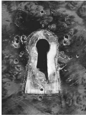
Toppa originale intarsiata d'osso. Notiamo la presenza di diversi fori di chiodi, evidente testimonianza della collocazione impropria d'altre precedenti borchie.

Questo è avvenuto in seguito ad un precedente restauro od a causa di un desiderio d'abbellimento per il variare del gusto; che soprattutto nella seconda metà dell'Ottocento divenne generalmente più carico d'ornamentazione, sia per il generale desiderio della borghesia di dimostrare il lusso più platealmente, sia in conseguenza di quanto prima enunciato sull'economicità dei processi di produzione. Essendo alcune di tali filettature danneggiate e comparando dietro tali borchie le tracce di altri fregi posti precedentemente, si tratta senz'altro di un restauro sbagliato ed un eventuale ripristino provvederà alla loro eliminazione ed alla riparazione di quelle d'osso originali. Quando negli arredi biedermeier compaiono tali borchie raramente sono originali. I cassettoni, anche quelli di altri arredi biedermeier, sono spesso di diverse altezze, per permettere di riporre differenti tipologie e per rompere la simmetria, costruendo una migliore resa architettonica a fini estetici, senza necessità di ornamenti aggiunti. Il fusto dei mobili dell'area mitteleuropea è generalmente eseguito in abete, variante dal rosso arancio a quello intenso, con venature chiare alternate da altre scure, sovente quello dei cassettoni del castello è invece di materiale più nobile: in questo caso è d'acero. Anche i pomelli dei cassettoni sono d'osso tornito.