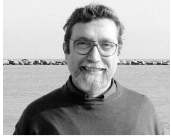
Pierdario Santoro - autore

Il blocco continentale, imposto da Napoleone nel 1806, per danneggiare le importazioni dall'Inghilterra, limitò l'uso del mogano in Europa, che costituiva, in valore, quasi il quaranta per cento di tutte le esportazioni britanniche. Gli inglesi n'erano divenuti monopolisti dopo avere conquistato alla fine del Settecento anche i possedimenti francesi nelle Antille, divenendo gli unici proprietari di piantagioni di mogano.