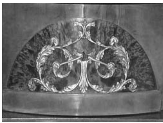
Importante fregio fitoforme di piombo dorato a foglia.

Le essenze fiorite sono ottenute artificialmente, potando più volte per diversi anni i rametti della cima degli alberi da cui si ricavano, come oggi si fa per un bonsai, favorendone così la continua vegetazione di nuovi, in modo da ricavare in questo breve tratto una superficie estremamente punteggiata; tale metodo era utilizzato soprattutto per quelle essenze prive di una radice abbondante e di qualità.