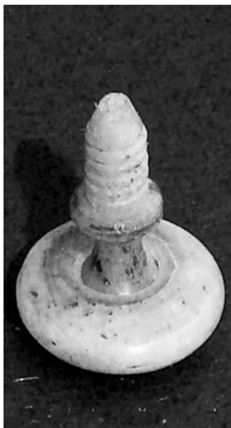
Pomello intero e smontato. Osserviamo l'abilità del tornitore che ha filettato anche lo stelo conicamente per favorirne il fissaggio al cassetto.

Questo è avvenuto in seguito ad un precedente restauro od a causa di un desiderio d'abbellimento per il variare del gusto; che soprattutto nella seconda metà dell'Ottocento divenne generalmente più carico d'ornamentazione, sia per il generale desiderio della borghesia di dimostrare il lusso più platealmente, sia in conseguenza di quanto prima enunciato sull'economicità dei processi di produzione. Essendo alcune di tali filettature danneggiate e comparando dietro tali borchie le tracce di altri fregi posti precedentemente, si tratta senz'altro di un restauro sbagliato ed un eventuale ripristino provvederà alla loro eliminazione ed alla riparazione di quelle d'osso originali. Quando negli arredi biedermeier compaiono tali borchie raramente sono originali. I cassettoni, anche quelli di altri arredi biedermeier, sono spesso di diverse altezze, per permettere di riporre differenti tipologie e per rompere la simmetria, costruendo una migliore resa architettonica a fini estetici, senza necessità di ornamenti aggiunti. Il fusto dei mobili dell'area mitteleuropea è generalmente eseguito in abete, variante dal rosso arancio a quello intenso, con venature chiare alternate da altre scure, sovente quello dei cassettoni del castello è invece di materiale più nobile: in questo caso è d'acero. Anche i pomelli dei cassettoni sono d'osso tornito.