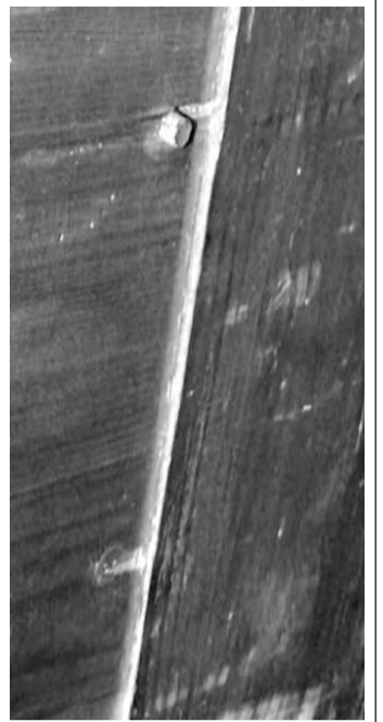
La schiena con i cavicchi di legno, che la fissano.

Il secretaire poggia su robusti parallelepipedi di legno, applicati sotto la cornice del basamento. Gli arredi di questo stile raramente mostrano appoggi scolpiti, come quelli zoomorfi preferiti nei precedenti mobili impero, ma sono collocati: direttamente a terra, su dadi o presentano i caratteristici piedi realizzati da un ingrossamento rettangolare del prolungamento dei montanti, con a terra uno zoccolo cubico costituito da quattro cornici applicate; come appare spesso nei succitati cassettoni erroneamente definiti impero. La schiena è inserita in scanalature ricavate nei montanti e fermata con cavicchi di legno; lo stesso per i fondi dei cassettoni, che però spesso non erano fermati, essendo sufficiente il perfetto incastro realizzato a mantenerli in posizione. La presenza di chiodi è generalmente dovuta ad interventi successivi; infatti, il loro uso era raro, non perché costassero (un fabbro specializzato poteva produrne più di mille al giorno), ma per lasciare il pannello libero ed evitare spaccature, che spesso si verificano a causa delle tensioni provocate dal naturale calo del legno.