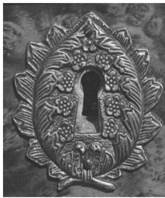
Borchia d'ottone, che decora la toppa.

Non dimentichiamo che fino a tempi recenti la manodopera non costituiva una spesa cospicua ed erano i materiali (essenze esotiche, ottoni e bronzi cesellati e dorati, placche di porcellana, rivestimenti di tartaruga, ecc.) a determinare per la maggior parte il costo delle opere d'arte applicata. I fregi d'ottone che coprono le buchette delle chiavi sono stati aggiunti successivamente e nascondono le filettature d'osso intarsiati originali.