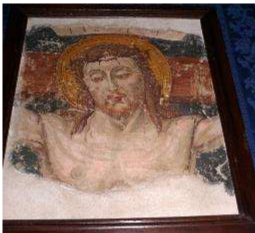
Stacco da affresco murale.

Nell' opera in esame troviamo analogie con la Scuola Pseudo Bramantina, del periodo Rinascimentale Lombardo; in particolar modo, osservando come sono intrecciati i capelli, come sono disegnati gli occhi, come si presenta l'anatomia e l'impostazione del volto, i colori e il disegno dell'aureola intorno alla testa del Cristo.