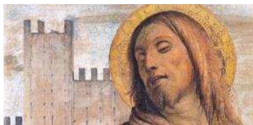
Particolare ripreso dall'opera "Noli me tangere" (affresco presente al Museo Civico d'Arte Antica, Castello Sforzesco di Milano).

Nell' opera in esame troviamo analogie con la Scuola Pseudo Bramantina, del periodo Rinascimentale Lombardo; in particolar modo, osservando come sono intrecciati i capelli, come sono disegnati gli occhi, come si presenta l'anatomia e l'impostazione del volto, i colori e il disegno dell'aureola intorno alla testa del Cristo.